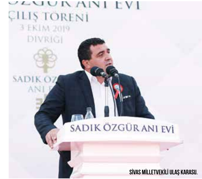
SİVAS MİLLETVEKİLİ ULAŞ KARASU.