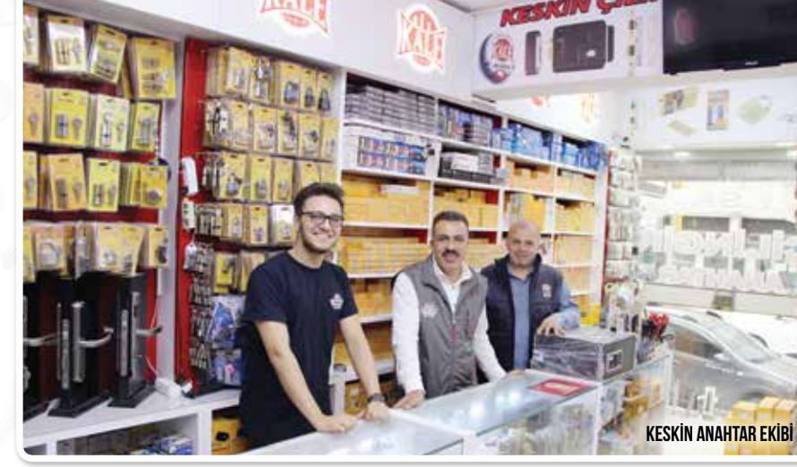
KESKİN ANAHTAR EKİBİ

Bahsettiğim gibi Kale Kilit'i tanımanız için illa ki sektörün içinde olmanıza gerek yok. Yoldan geçen birine sorsanız bile bu sektörde ilk vereceği isim Kale Kilit olacaktır. Markanın yıllar boyunca yarattığı bu güven