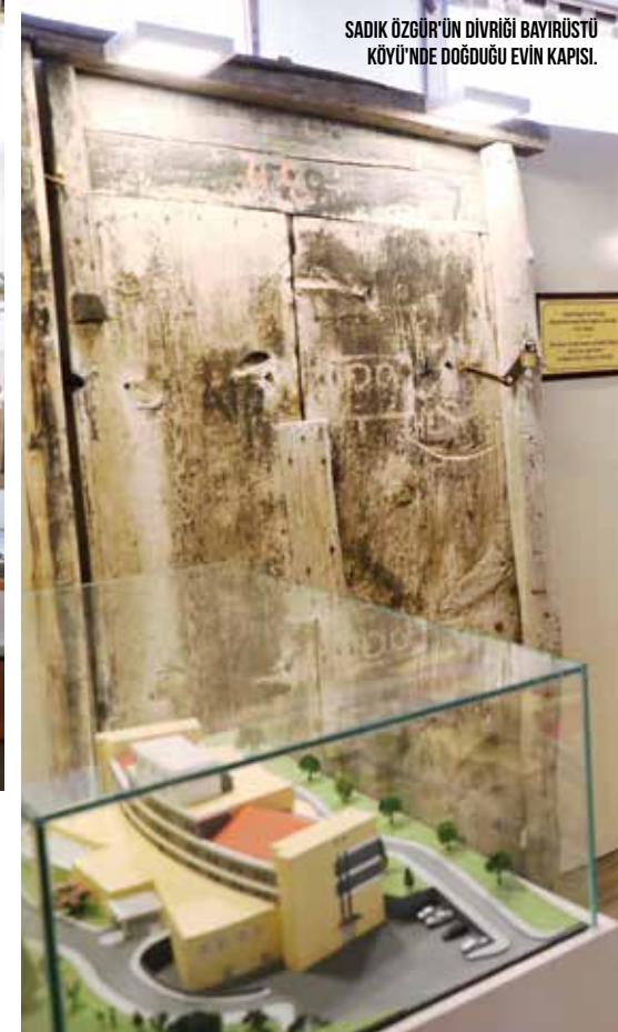
SADIK ÖZGÜR'ÜN DİVRİĞİ BAYIRÜSTÜ KÖYÜ'NDE DOĞDUĞU EVİN KAPISI.