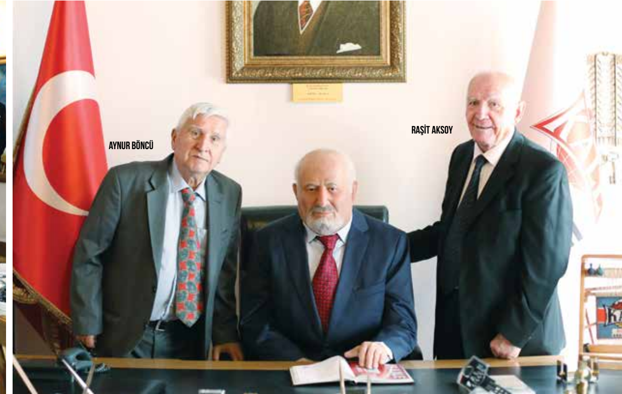
ESKİ USTALAR BİR ARADA...