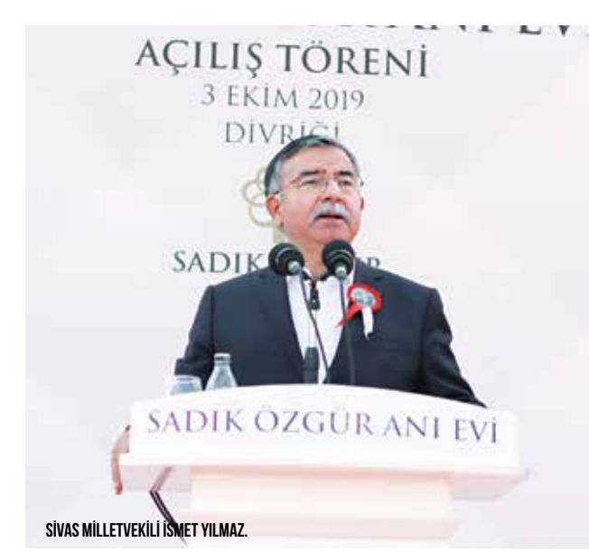
SİVAS MİLLETVEKİLİ İSMET YILMAZ.