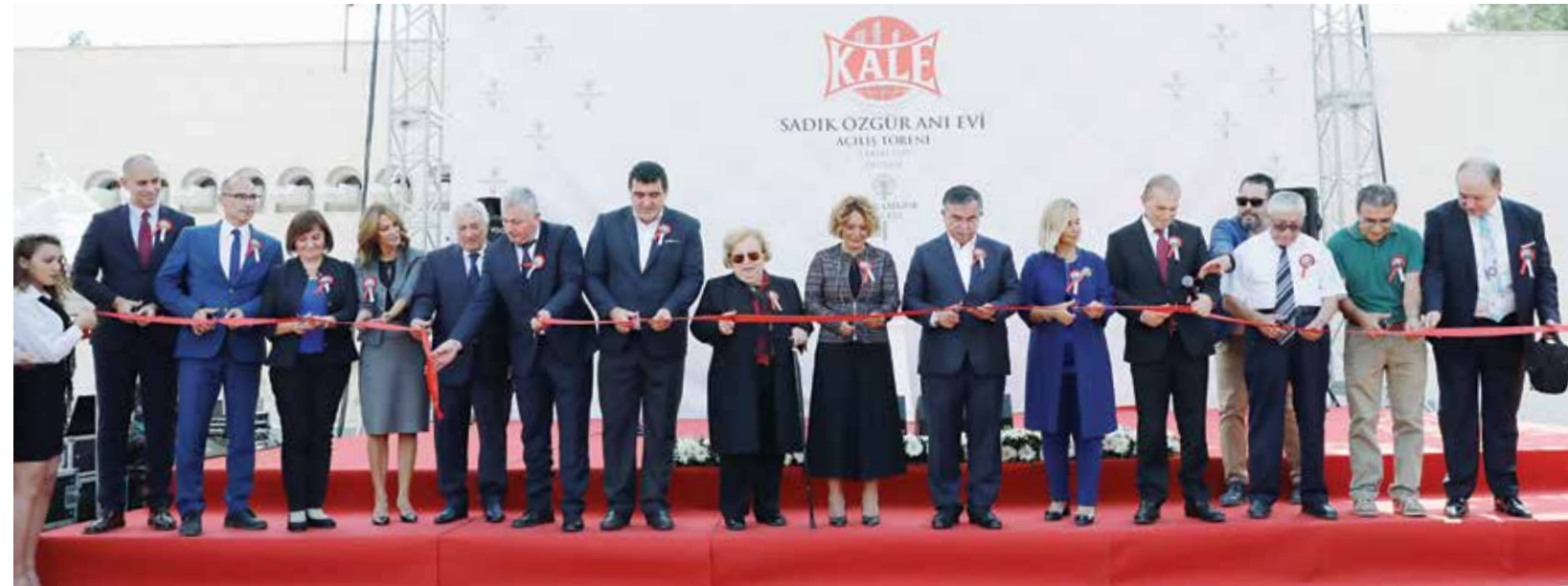
ANI EVİ'NİN AÇILIŞ TÖRENİNE BİRÇOK DEĞERLİ İSİM KATILDI.